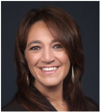
Cristina Monge MODERADORA

Es jurista, profesora universitaria y funcionaria española, actual vicepresidenta tercera y ministra para la Transición Ecológica y el Reto Demográfico del Gobierno de España. Ha sido directora ejecutiva del Instituto de Desarrollo Sostenible y Relaciones Internacionales.