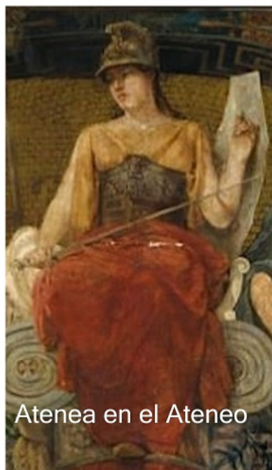
Atenea en el Ateneo